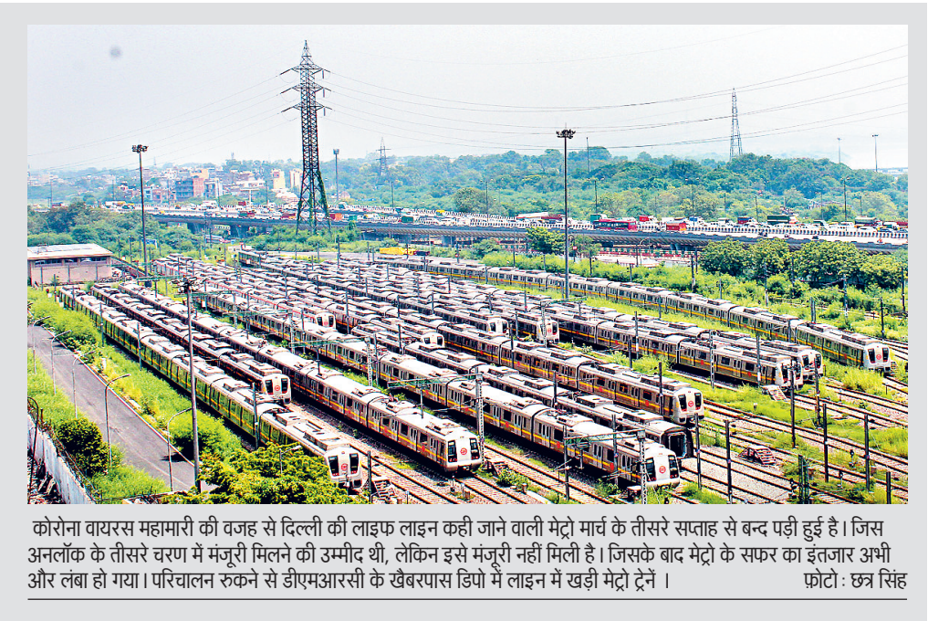
कोरोना वायरस महामारी की वजह से दिल्ली की लाइफ लाइन कही जाने वाली मेट्रो मार्च के तीसरे सप्ताह से बन्द पड़ी हुई है। जिस अनलॉक के तीसरे चरण में मंजूरी मिलने की उम्मीद थी, लेकिन इसे मंजूरी नहीं मिली है। जिसके बाद मेट्रो के सफ़र का इंतजार अभी और लंबा हो गया। परिचालन रुकने से डीएमआरसी के खेबरपास डिपो में लाइन में खड़ी मेट्रो ट्रेनें ।