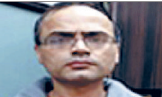
2018 को इंडिया फैक्टरिंग एंड फाइनेंस सॉल्यूशंस प्राइवेट लिमिटेड के अधिकृत